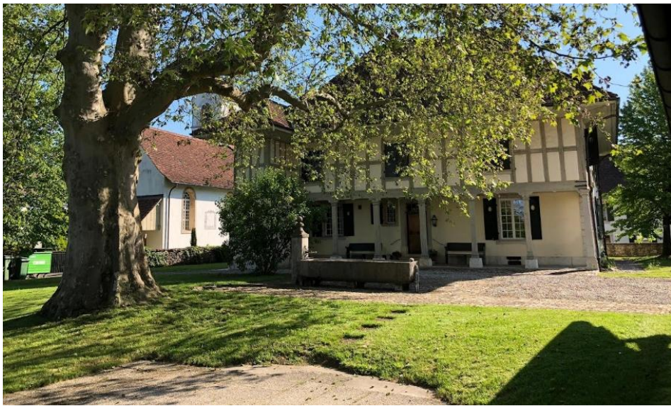
Gottesdienste feiern im Pfarrhof Rüti