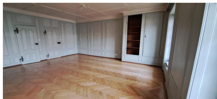
Herrengasse 4, 3295 Rüti b. Büren

Details auf dem Flyer der verteilt wird, oder auf un-serer Webseite www.kgrueti.ch .